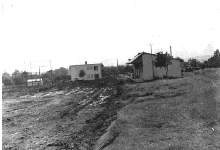
Rekonstrukce herní plochy na fotbalovém hřišti

Sportovní politika obcí vychází z jejich potřeb a odvíjí se od kulturně historických tradic. Obce se spolupodílejí na financování sportu, koordinují činnosti sportovních subjektů ve prospěch obce, respektive svých občanů a kontrolují efektivnost vynaložených veřejných zdrojů. Obec tak v samostatné působnosti ve svém územním obvodu pečuje v souladu s místními předpoklady a s místními zvyklostmi o vytváření podmínek pro rozvoj sociální péče a pro uspokojování potřeb svých občanů, jako je uspokojování ochrany a rozvoje zdraví, kulturního rozvoje, výchovy a vzdělávání, dle zákona č. 128/2000 Sb., o obcích (obecní zřízení).